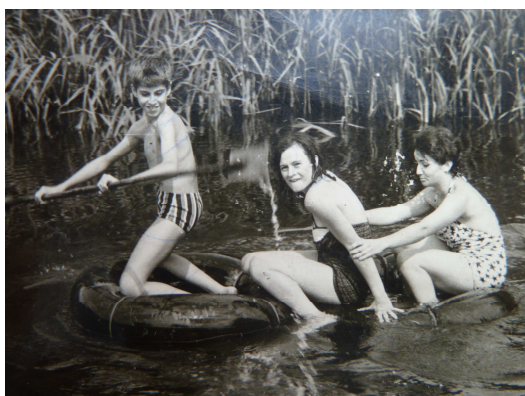
Embarcations originales sur le plan d'eau.