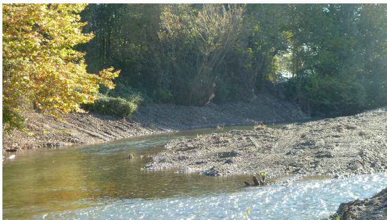
Le plan d'eau s'étendait sur toute la largeur.