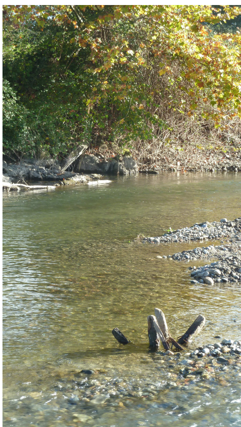
Seuls 4 piquets sont encore en place