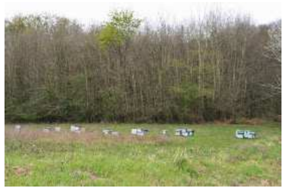
Les abeilles des ruches de Nicolas attendent avec impatience les fleurs de châtaigniers.