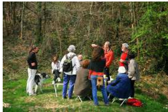
Projet d'une future balade : emprunter le GR 101 qui rejoint le chemin d'Arles aux Sanctuaires de Lourdes en passant par la fontaine Saint-Esselin et la forêt communale en prenant garde ne pas se cogner au Méridien 0 dit de Greenwich qui passera au-dessus de notre tête.