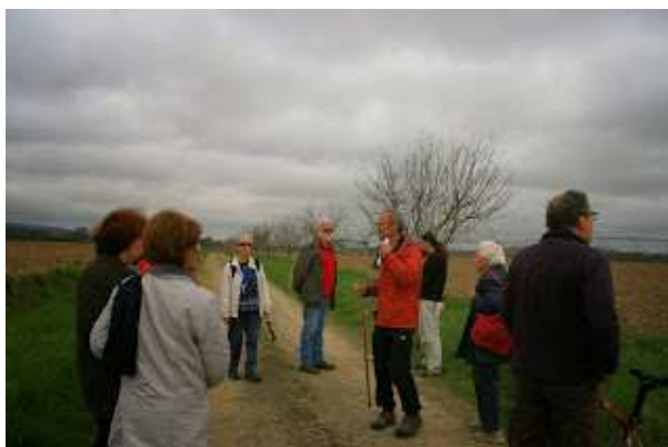
Départ par le chemin rural vers l'Aysa. A noter la plantation de pommiers réalisée lors du dernier aménagement foncier.