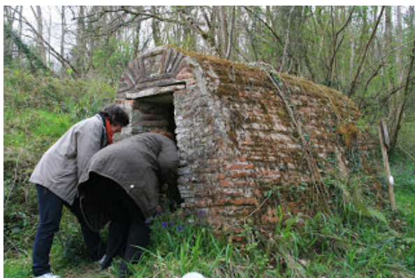
La fontaine est à sec... Pauvres pèlerins !