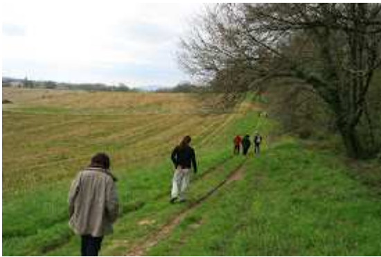
A flanc de colline le groupe s'étire...