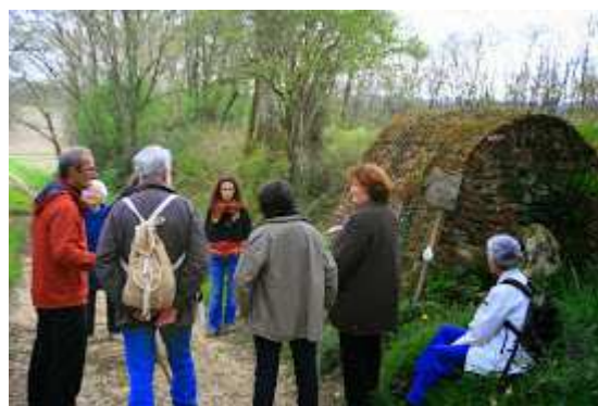
Quelques commentaires sur l'édifice... et ce qu'il a recélé.