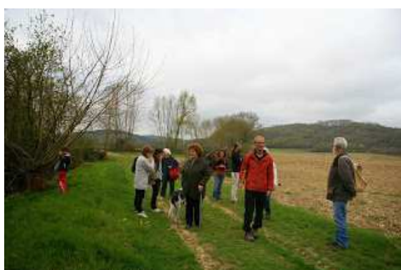
Petite halte sur les bords de l'Aysa.