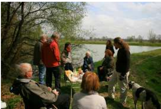
Midi sonne au clocher de l'abbatiale : c'est l'heure du réconfort au bord du lac. Une mémoire locale nous a rejoints.