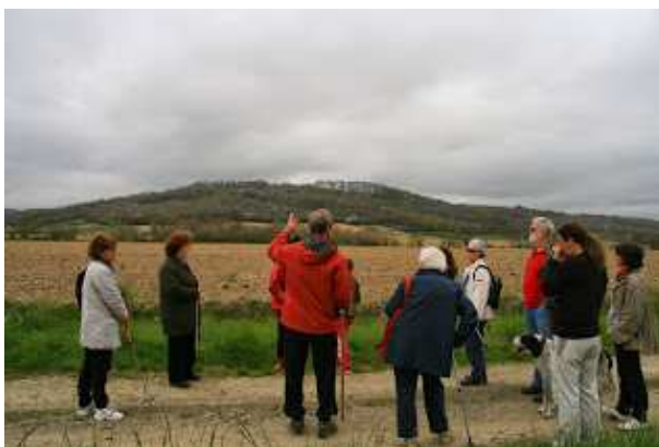
Indication du chemin de retour à flanc de colline.