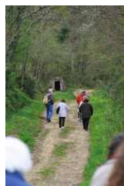
Sur le chemin d'Arles à Saint-Jacques (GR 653). La fontaine Hount de bach est en vue mais la pente est dure... Derrière Maubourguet devant Lahitte-Toupière.